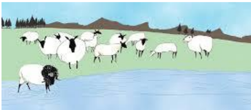
Psalm 23