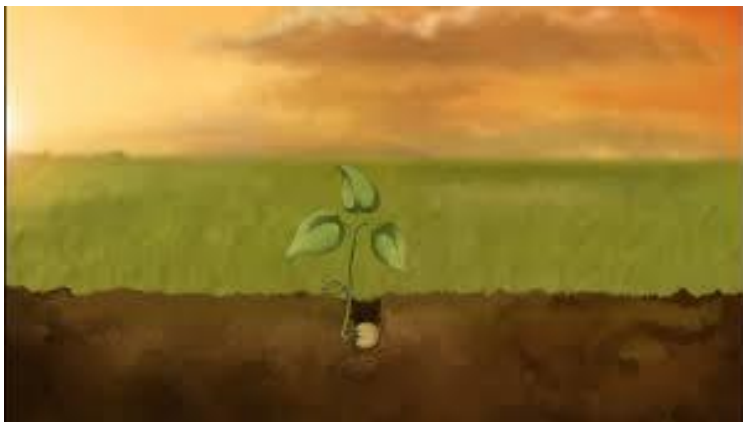
Een mosterdzaadje